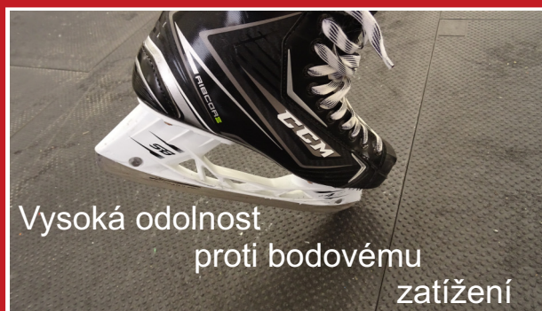
Vysoká odolnost proti bodovému zátížení