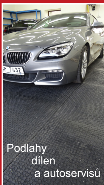
Podlahy dílén a autoservisů