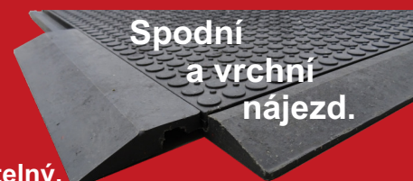
Spodní a vrchní nájezd.

Desky jsou opatřeny zámkem - systém je rozebíratelný.