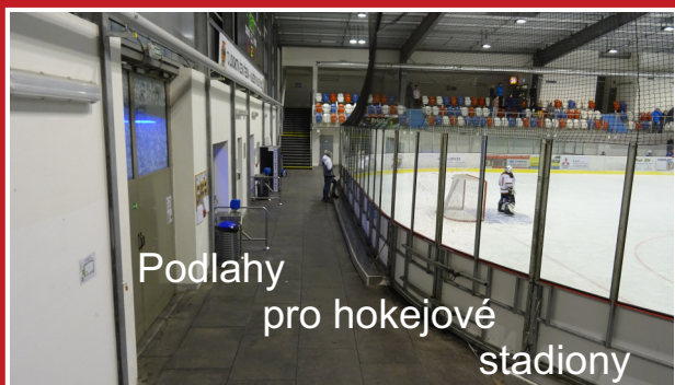
Podlahy pro hokejové stadiony

*Nášlapná plocha 1160x760 mm (deska má zámky)