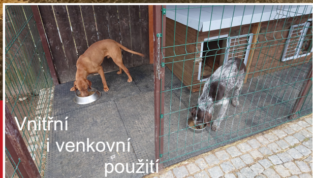
Vnitřní i venkovní použití