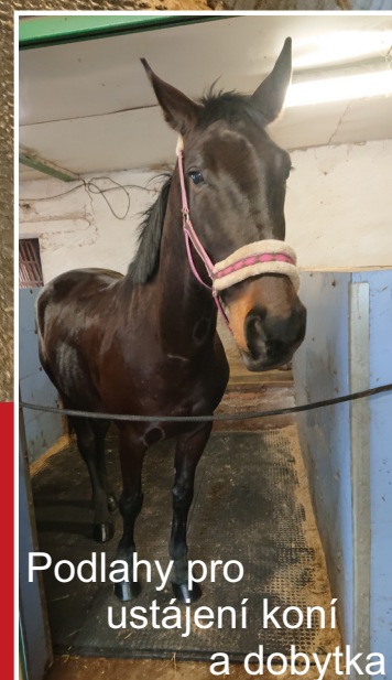
Podlahy pro ustájení koní a dobytka