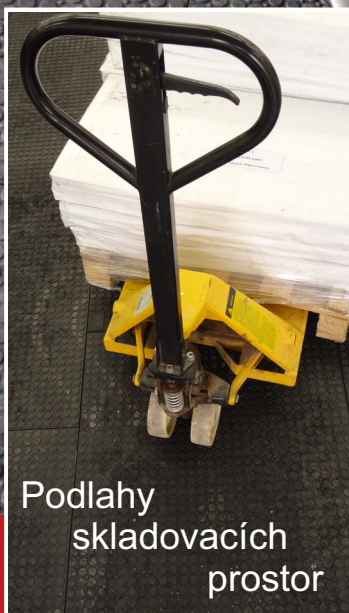
Podlahy skladovacích prostor

Zátěžová podlahová deska z PVC OBOUSTRANNÁ.