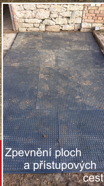
Zpevnění ploch a přístupových cest