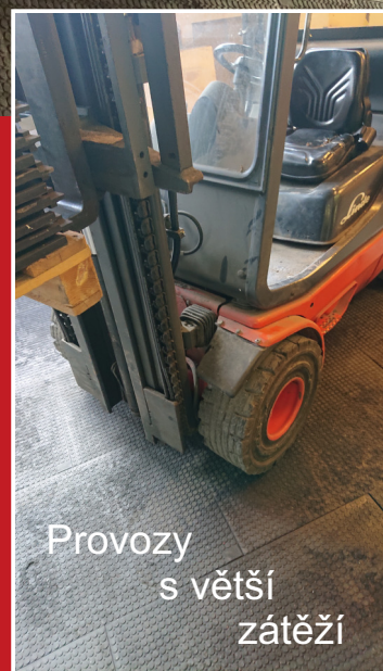
Provozy s větší zátěží